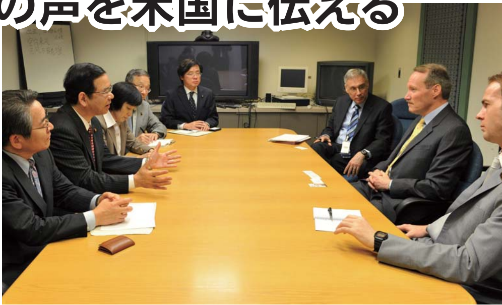
5月7日、ワシントンで米務省のメア日本部長らと会談

アメリカを訪れて米政府と直接 会談。日本の政党で唯一、「解決 の道は無条件撤去しかない」と県 民・国民の意思を直接伝えた。