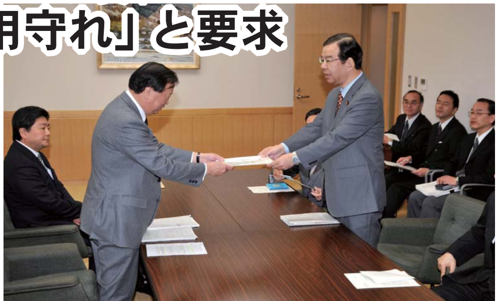
トヨタに要望書を手渡す

「派遣切り」を国会でとりあげる とともに、トヨタやキヤノンなど の経営者や日本経団連に直接、 「雇用を守る社会的責任を果た せ」と迫った。