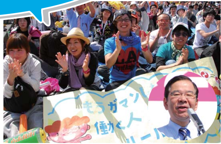
全国青年大集会であいさつ

仕事・雇用の苦しみに 「もうガマンしない!」 と5200人が集まった 全国青年大集会。