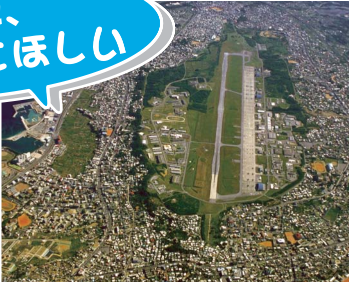
沖縄の米軍・普天間基地

政府は名護市辺野 古への新基地建設と、 鹿児島など全国への 米軍訓練拡大をアメ リカと「合意」