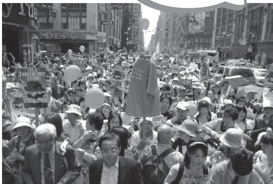
▲核不拡散条約（NPT）再検討会議成功に向けてNYに集まってきた世界中の人々のパレード