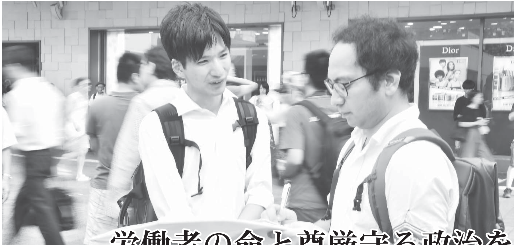
▶「長時間労働は、労働者にメリットはない」と話す男性(10日、渋谷)