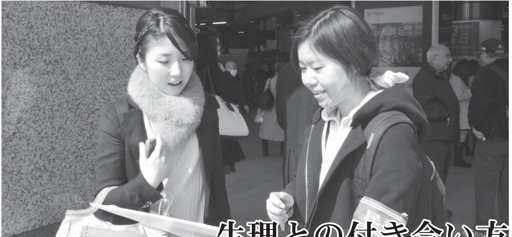
▶「生理休暇の権利があるのは知らなかった」と話す薬剤師の女性(26)。(2月28日、新宿駅)